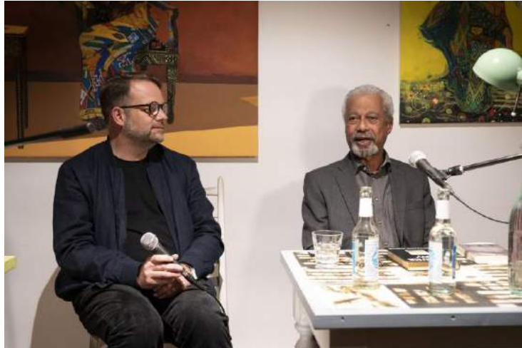
Abdulrazak Gurnah zu Gast bei stimmen afrikas, Oktober 2018

Wissenstransfer von Süd nach Nord anregen und das Bewusstsein für die Pluriversalität der Lebensentwürfe und Perspektiven schärfen. Mit dem aktuellen Projektvorhaben sollen Themen und künstlerische Potenziale von BIPOC, insbesondere die von Schwarzen Frauen* in die Arbeit einfließen und sichtbar gemacht werden.